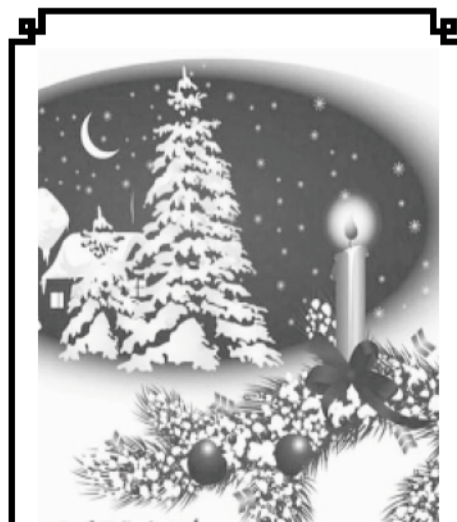
График мероприятий 8 января