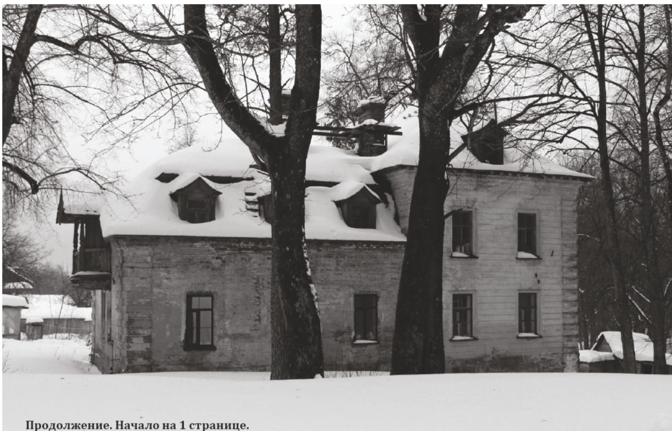
Продолжение. Начало на 1 странице.