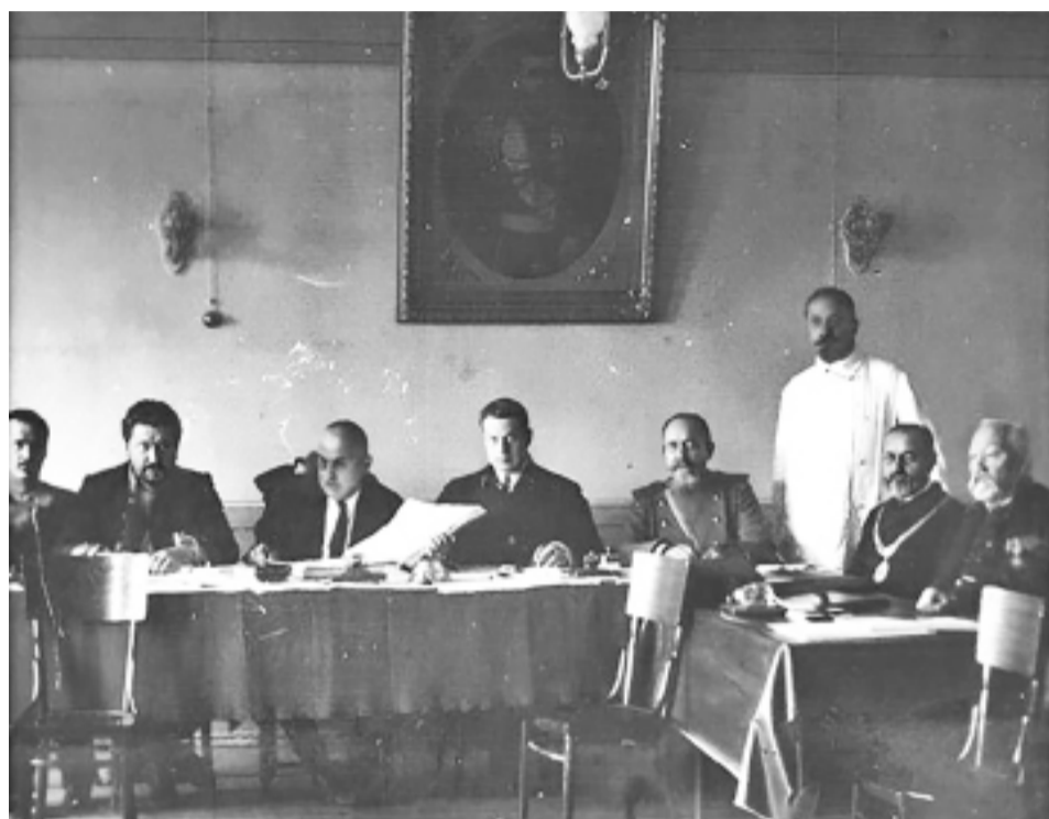
Фото съезда мировых судей (год не обозначен)

В фондах Сычевского краеведческого музея и Сычевской центральной библиотеки имеются фотографии съездов судей.