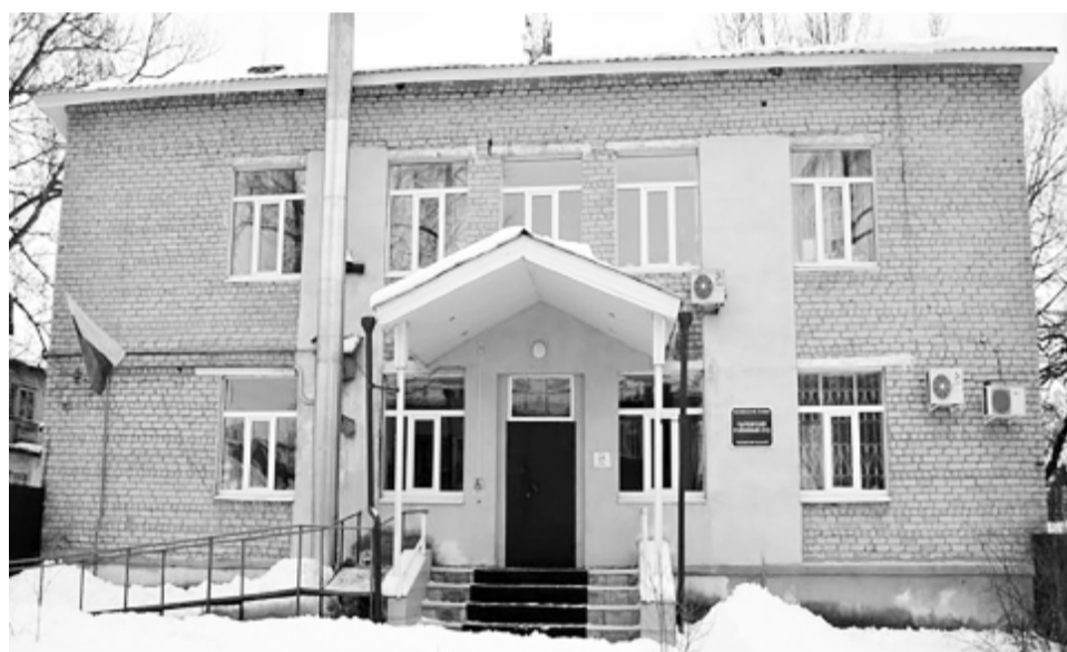
Здание Сычевского районного суда (г. Сычевка ул. К. Маркса, д. 7)

2023 год будет насыщен юбилейными событиями: 155-летие судебной системы Смоленской области, 80-летие освобождения города Сычевки от немецко-фашистских захватчиков, 80-летие освобождения Смоленщины от немецко-фашистских захватчиков, 80-летие Сычевского районного суда и др.