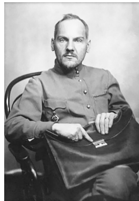
Николай Васильевич Крыленко, председатель Верховного суда СССР (1923-1924 гг.)