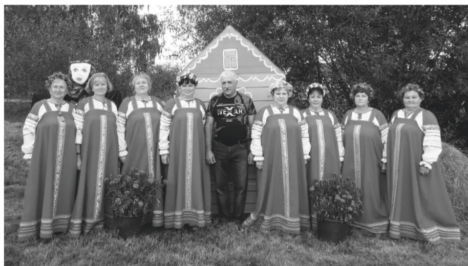
Вокальный коллектив «Рябинушка» (Никольский СДК)

Этот профессиональный праздник отмечают хранители и создатели культуры — сотрудники музеев и библиотек, специалисты домов культуры, коллективы художественной самодеятельности.