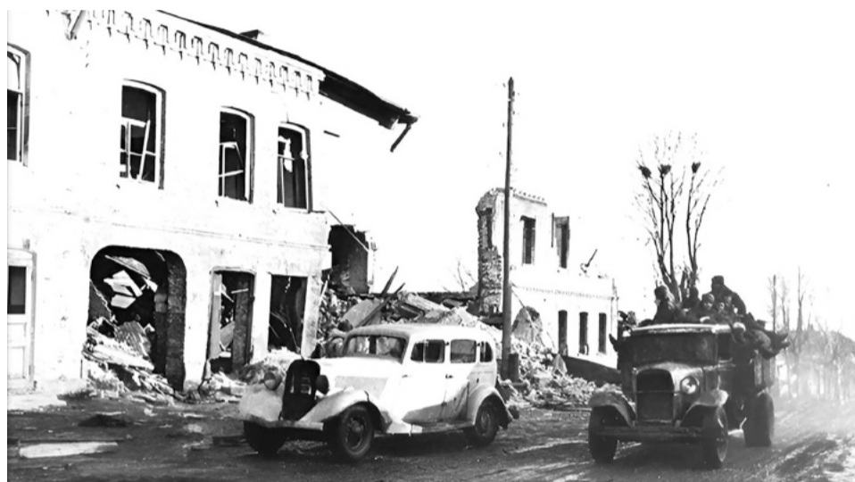
Разрушенное здание суда по ул. К. Маркса д. 5

Продолжение. Начало материала в № 11 (11024) от 16 марта 2023 г. газеты «Сычевские вести»