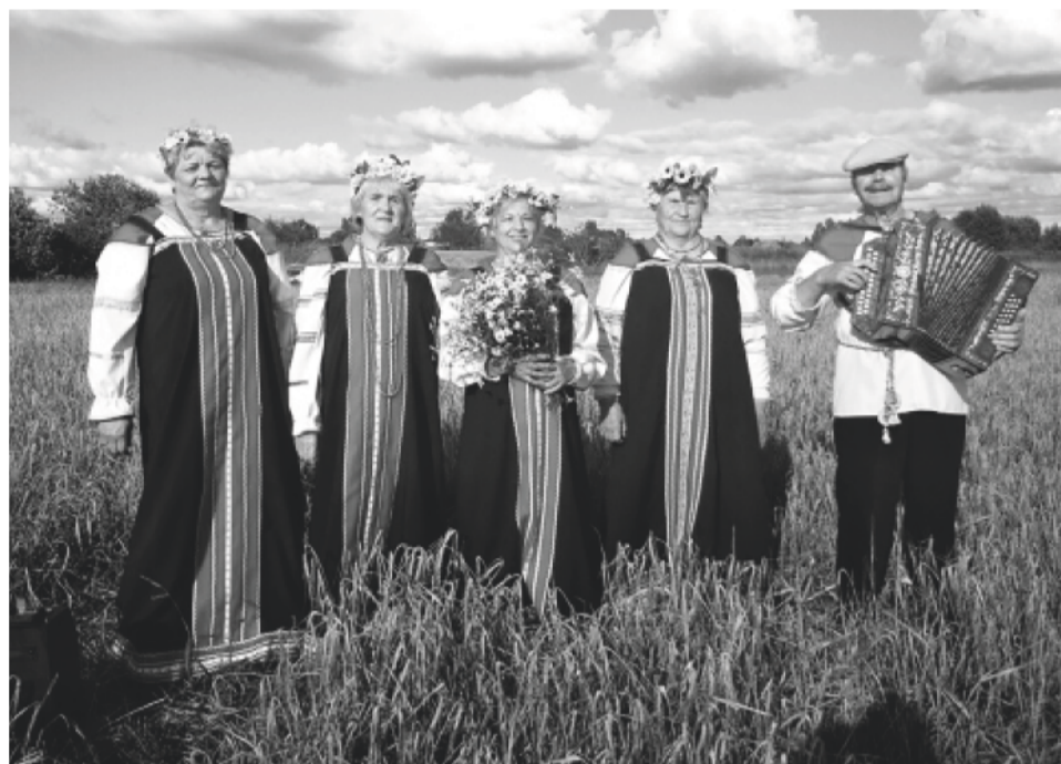
Вокальный коллектив «Селяночка» (Никитский СДК)