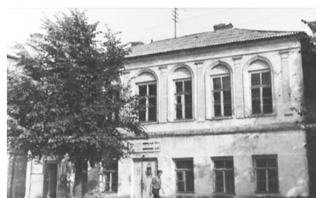
Купеческий дом по ул. К. Маркса д. 6, где в 70-е годы дислоцировался суд