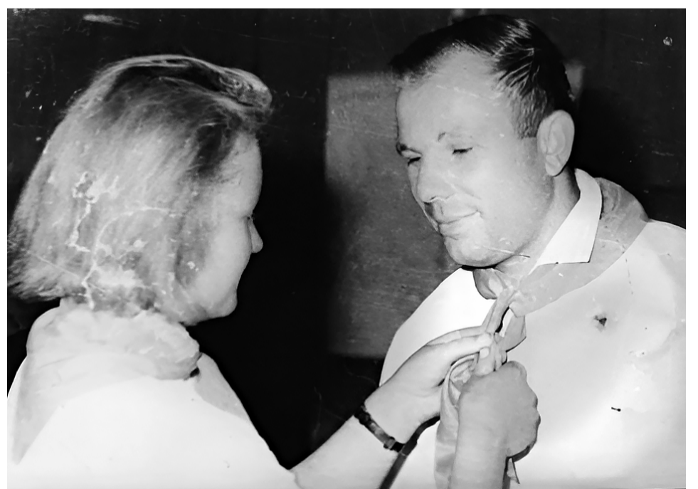
Юрий Алексеевич встретился с пионерским отрядом им. А. Матросова из Бехтеевской восьмилетней школы, который принял Пионера Космоса в почетные пионеры