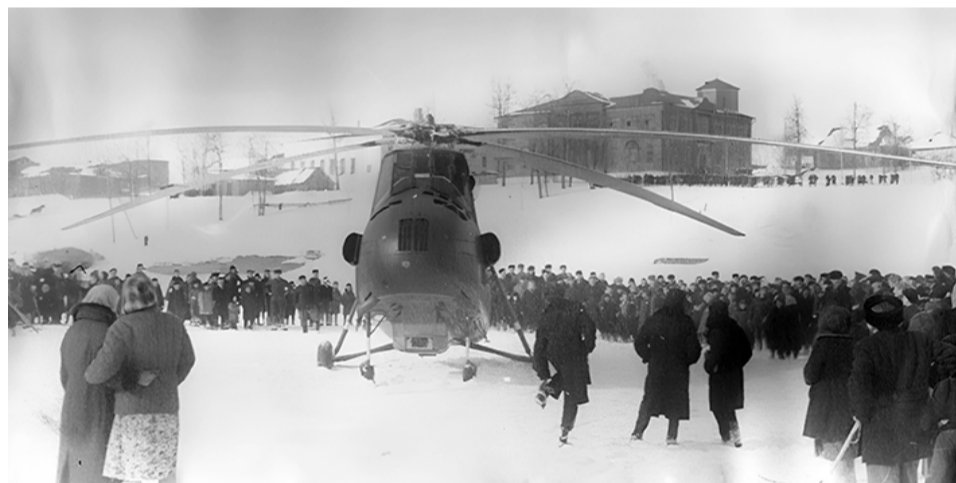
Вертолет, на котором прилетел в Сычевку Ю.А. Гагарин, опустился на городском стадионе, за рекой Вазузой, 1963 год