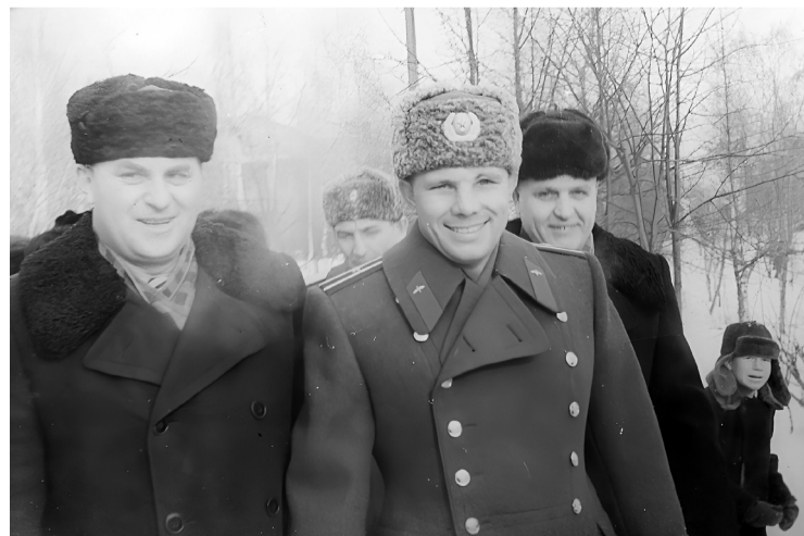
Ю.А. Гагарин и брат Анны Федоровны. Фотография сделана в 1963 году в нашем парке. Кстати, мальчик на заднем плане и есть тот, кого она спасла

- Да, Гагарин приезжал в Сычевку, и я его видела в 1962 и 1963 годах. Хотя рассказывали потом, что он несколько раз приезжал на рыбалку, охоту сюда куда-то. Видно, ему здесь очень понравилось, как моему брату и мне когда-то.