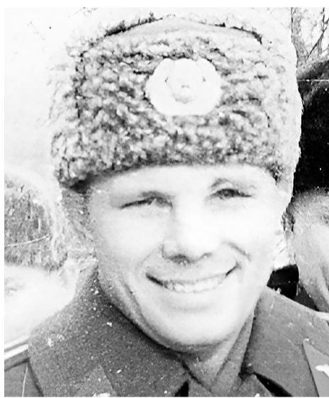
Снимок сделан во время пребывания Ю.А. Гагарина в Сычевке

А день первого полета Ю.А. Гагарина в космос – 12 апреля – стал государственным праздником – Днем космонавтики.