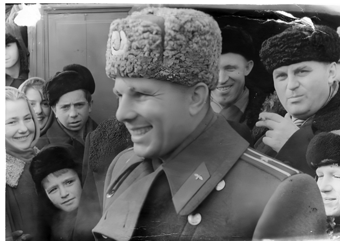
Ю.А. Гагарин на встрече с сычевлянами, 1963 год