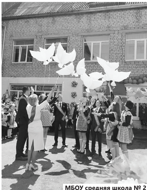
МБОУ средняя школа № 2

Двадцать второго мая, в 9 школах Сычевского района прозвенел «Последний звонок», посвященный завершению 2022-2023 учебного года.