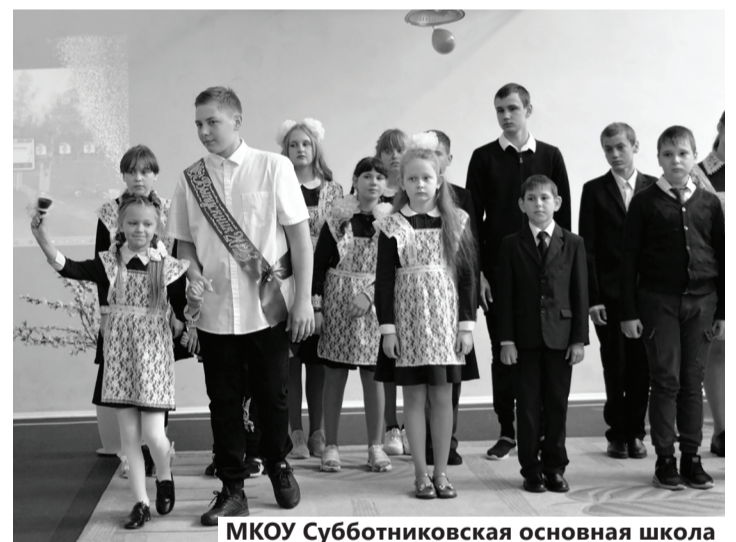
МКОУ Субботниковская основная школа