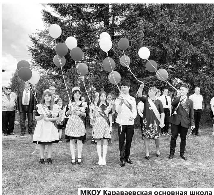
МКОУ Караваевская основная школа