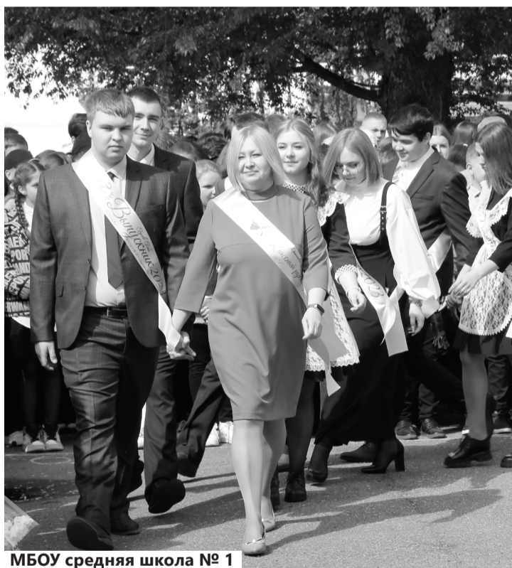
МБОУ средняя школа № 1