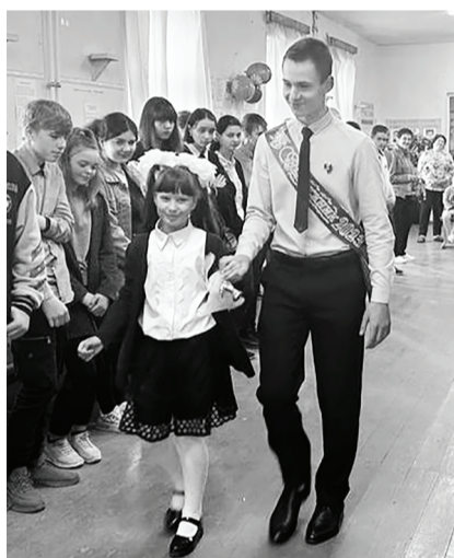
МКОУ Юшинская основная школа