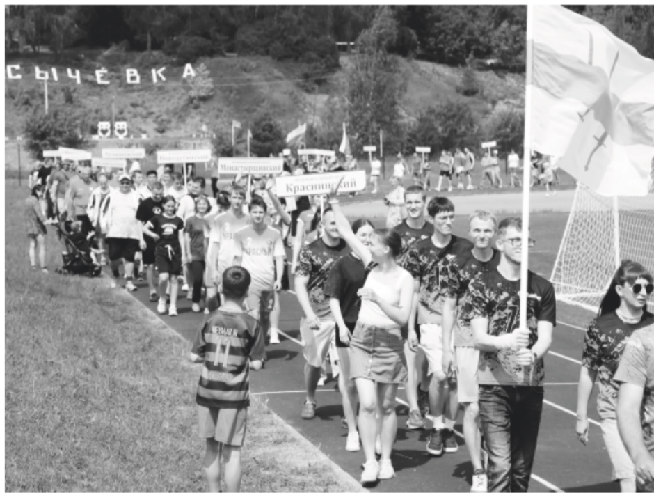
Продолжение на 5 странице.

Выступающие подчеркнули важность таких мероприятий, которые объединяют нас, смолян, и способствуют развитию спорта в муниципальных образованиях Смоленщины.