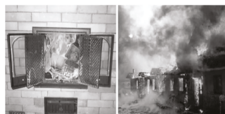
Не оставляйте огонь без присмотра

ПРИ ПОЖАРЕ звонить 01 с мобильных 101 или 112