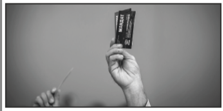
Печатная площадь предоставлена на безвозмездной основе Смоленскому региональному отделению Всероссийской политической партии «ЕДИНАЯ РОССИЯ»

В команду главы региона войдут люди, готовые работать 24 на 7. Те, кто готов отдать все свои силы и время на благо Смоленской области.