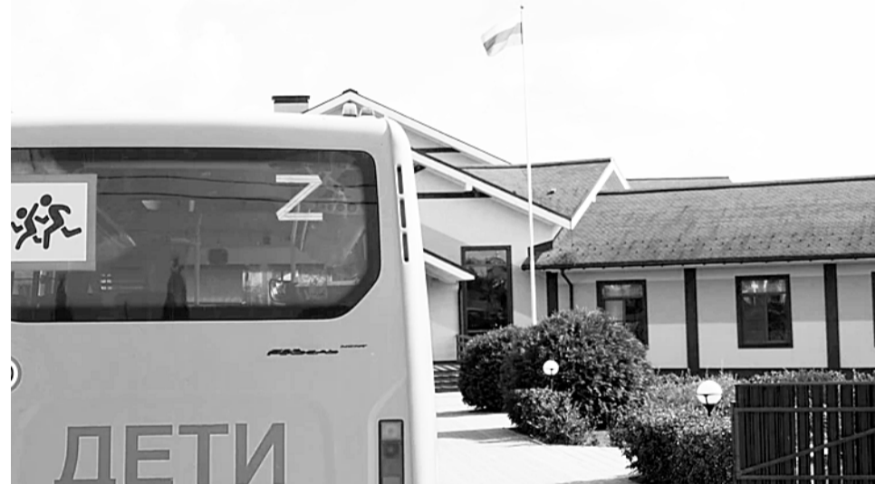
По сельским меркам школа-интернат «Феникс» в Мольгино — настоящее чудо

Еще один поворот по главной улице Высокого - появляется школа. Она в строительных лесах. За новой теплоэф-