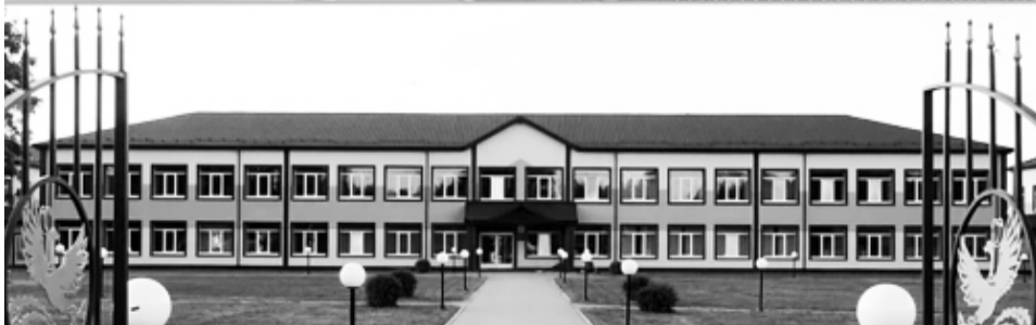
Школа и новые дома в Дугино (а также в соседних селах) выполнены в едином дизайн-коде

трехсот смоленских деревень. В ту войну погиб каждый третий местный житель.