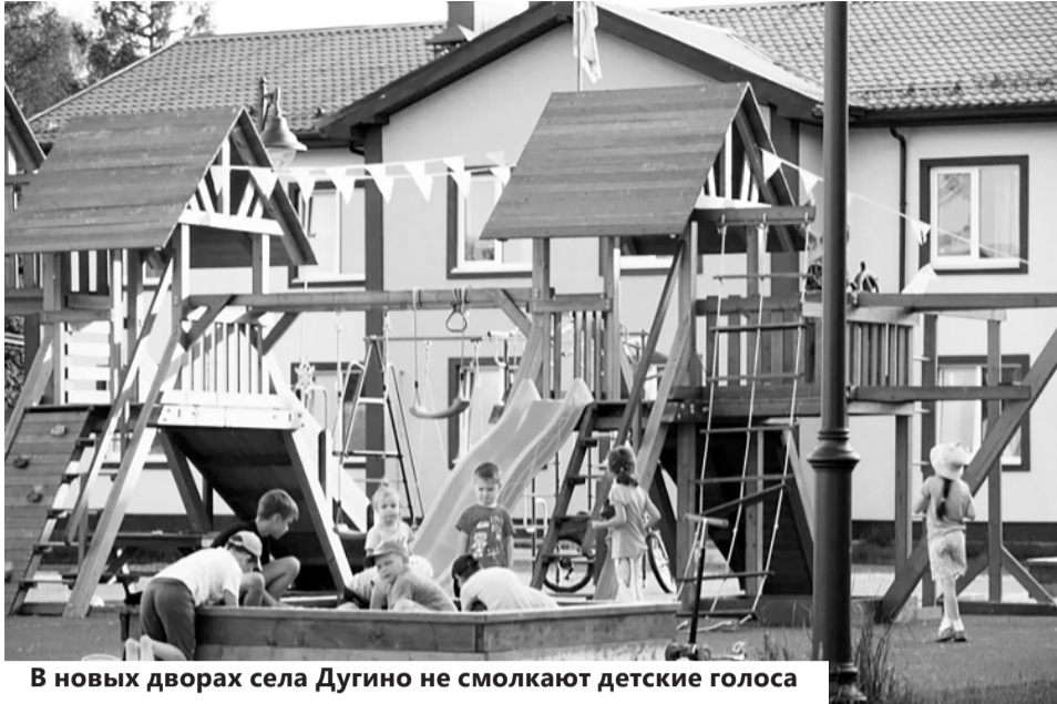
В новых дворах села Дугино не смолкают детские голоса