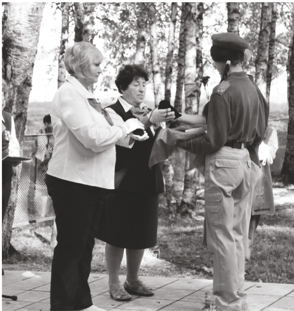
Подробнее читайте на 3 странице.

Почтить память сибиряков, воевавших в 312-ой стрелковой Смоленской Краснознаменной орденов Суворова и Кутузова дивизии, погибших и захороненных на Сычевской земле, прибыла делегация поисково-патриотического клуба «Отечество», созданного при совете ветеранов Карасукского района Новосибирской области.