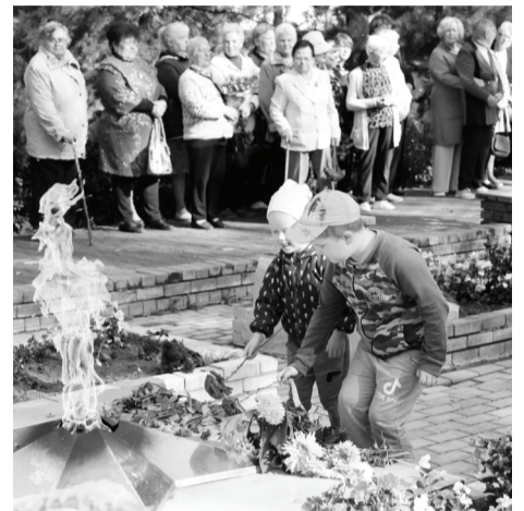
Возложение цветов юными сычевлянами к «Вечному огню»