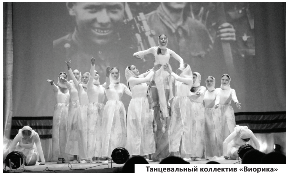
Танцевальный коллектив «Виорика»