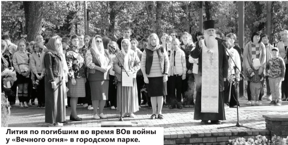
Лития по погибшим во время ВОВ войны у «Вечного огня» в городском парке.

Двадцать пятого сентября знаменательная дата не только для смолян, но и для всего российского народа. В этот день в 1943 году Смоленщина была освобождена от немецко-фашистских оккупантов. Одной из первых она приняла на себя внезапный удар фашистской Германии. И только благодаря героическому подвигу партизан, большому патриотизму и мужеству наших солдат, в результате жестоких кровопролитных боев на Смоленской земле гитлеровские захватчики получили решительный отпор и не смогли осуществить план молниеносной войны.