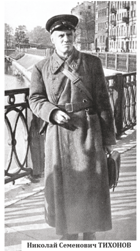
Николай Семенович ТИХОНОВ

«Одна из бомб попадет зимой в пальмовую оранжерею — пальмы погибнут от холода уже к утру. Медсестрам в белых халатах запретят перебежать по двору. Раненый пленный немец, придя в себя, истерично требует перевести его отсюда. Его успокаивают — это госпиталь. Оказывается, его пугает именно это — немецкие летчики стараются бомбить их в первую очередь».