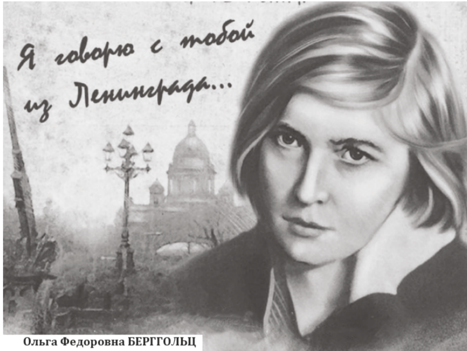
Ольга Федоровна БЕРГГОЛЬЦ