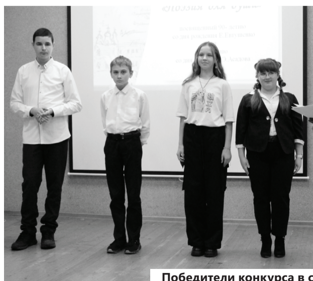
Победители конкурса в своих возрастных категориях