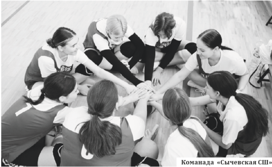
Команда «Сычевская СШ»