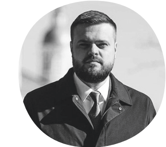
Уважаемые смоляне, дорогие земляки!

Поздравляю вас с Днем народного единства!