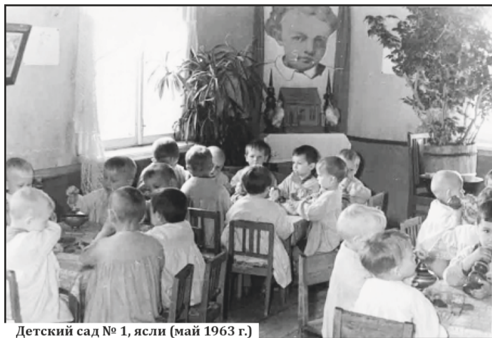
Детский сад № 1, ясли (май 1963 г.)