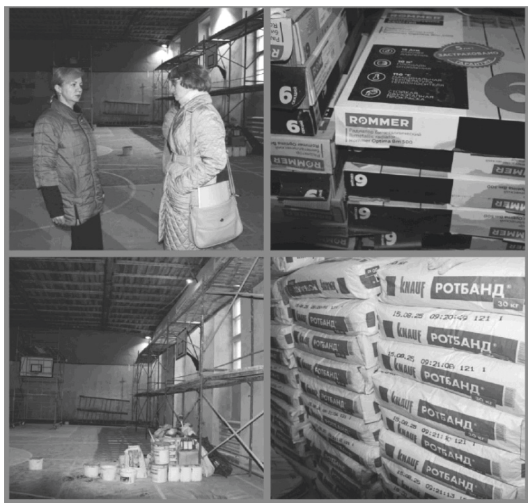
Ремонт спортивного зала МБОУ СШ № 2 г. Сычевки

Елена Журавлева.