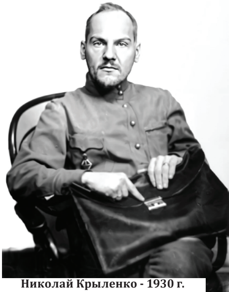
Николай Крыленко - 1930 г.

Его жизнь — это отражение всей противоречивой эпохи нашего государства и восхождения к непокоренным вершинам.