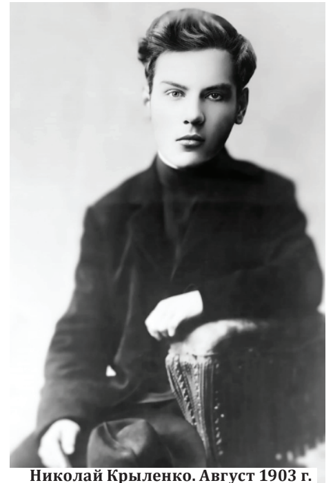
Николай Крыленко. Август 1903 г.

В истории каждой страны есть личности-титаны, чьи судьбы подобны горным хребтам — с ослепительными взлетами и трагическими обрывами. Николай Васильевич Крыленко — самая неординарная и многогранная фигура революционного Олимпа. Революционер-подпольщик, первый Верховный главнокомандующий Красной Армии, нарком юстиции, а вместе с тем — страстный альпинист, первооткрыватель и отец советского туризма, и это далеко не все грани его таланта.