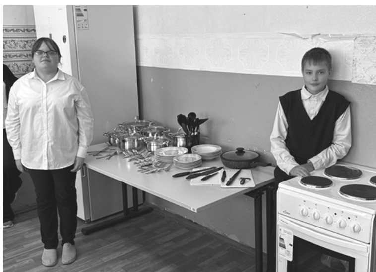
Оснащение школ округа оборудованием для уроков технологии в рамках регионального проекта «Все лучшее детям» национального проекта «Молодежь и дети»