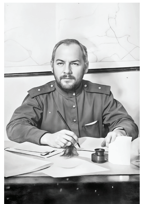
Николай Крыленко. 1918 г.

Процессуальная практика, отрицающая презумпцию невиновности. Крыленко считал высшим доказательством вины подсудимого его личное признание. Это убеждение открывало дорогу пыткам и «конвейерным» методам ведения следствия. Он был главным обвинителем на всех ключевых фабрикованных процессах 1920–30-х годов: по делу «Тактического центра», правых