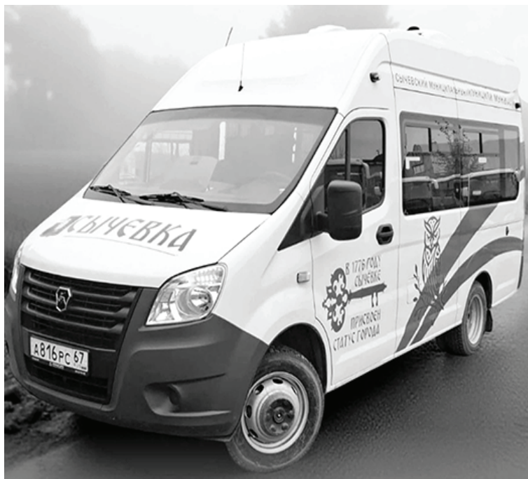
Маршрутное такси в городе Сычевке