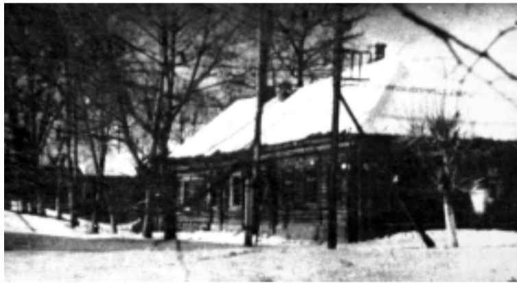
Явочная квартира партизан отряда «Родина» в г. Сычевке на углу ул. Гоголя и Б. Советской