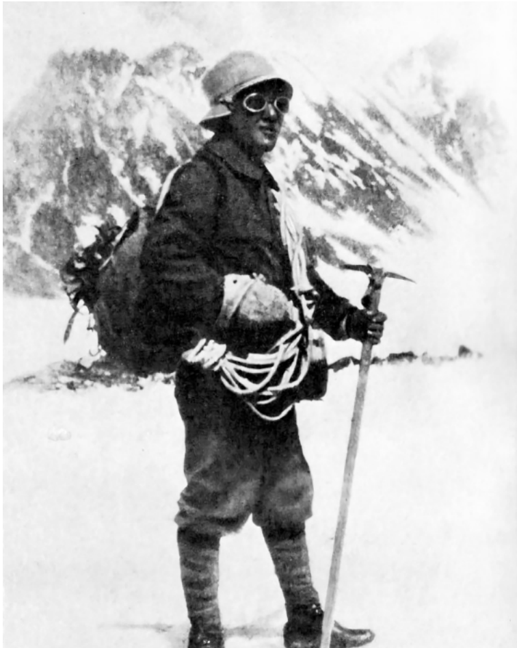
Николай Крыленко. Экспедиция к пику Гармо Памир. 1932 г.

Продолжение. Начало в газете «Сычевские вести» № 48 (11165) от 27 ноября 2025 года.