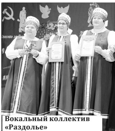
Вокальный коллектив «Раздолье»